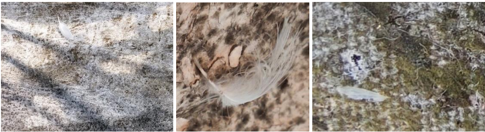
Piume 'catturate' dalle tele installate nei pressi degli ambienti acquatici

L'osservazione al microscopio si è focalizzata soprattutto sulle barbule delle piume ed ha evidenziato rami, nodi, internodi e i pigmenti che danno il color finale alle penne. Queste sono alcune microstrutture importanti per l'identificazione.